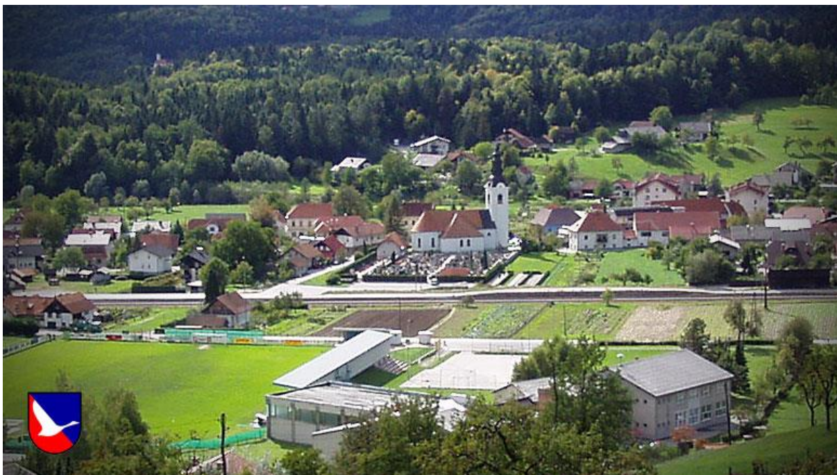
Slika 2: Šmartno ob Paki