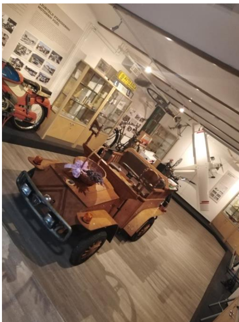
Slika 3: Notranjost muzeja tehnične kulture po 2. sv. vojni

kolo, ki je v stanju, kakršnega so našli. Ogromno modelarsko letalo, krasno zbirko fotoaparátov ter še marsikaj.