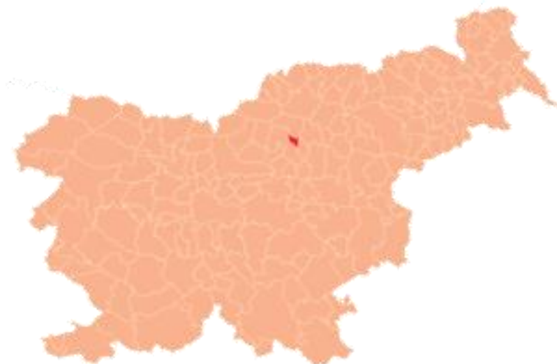
Slika 2: Lega občine Šmartno ob Paki.

Občina Šmartno ob Paki se nahaja sredi Slovenije, na stičišču treh slikovitih dolin: Šaleške, Spodnje in Zgornje Savinjske doline. Po površini se med dvesto dvanajstimi slovenskimi občinami uvršča na 204. mesto. Je majhen kraj, ki med svojimi griči in dolinami skriva veliko zanimivosti. Jedro naselja se je razvilo ob cerkvi sv. Martina in je bilo prvič omenjeno leta 1256. Industrije tod skorajda ni in tudi to prispeva k mamljivi podobi neokrnjenega naravnega okolja. V zaselku Gorenje se je po drugi svetovni vojni rodila znamenita tovarna Gorenje . Zdaj tam obratuje proizvodna enota Keramika . Občina ima nekaj deset podjetji, ki zaposlujejo večje število delavcev in ustvarijo visoke prihodke. 1